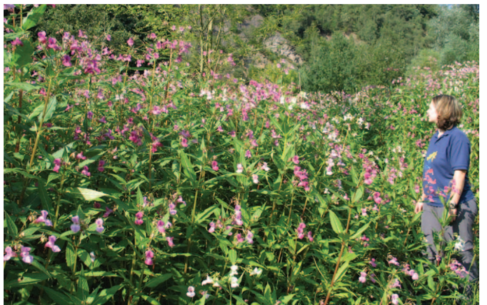
Foto 2: Balsaminen-Dickicht: das drüsiges Springkraut ist eine gute Bienenweidepflanze, sollte aber nicht gezielt weiter verbreitet werden.

liefert solche Nektarmengen, dass manche Imker auf eine Winteraufzucht verzichten können. Ein idealer Lückenfüller für die spätsommerliche trachtarme Zeit sollte man meinen. Doch anders als in seinem Ursprungsland Ostindien ist der verheißungsvolle Neubürger bei uns keine unauffällige Pflanze mit winzigem Verbreitungsgebiet. In Europa bildet sie blitzschnell dichte Bestände (Foto 2), zieht monatelang bestäubende Insekten in ihren Bann und raubt damit einheimischen, weniger durchsetzungsstarken Arten Lebensraum und die Chance selbst Samen zu bilden. Riesenbärenklau, Kanadische Goldrute (Foto 3) und die „beste bisher bekannte Spättracht“, der Bienenbaum (auch Wohlduft-