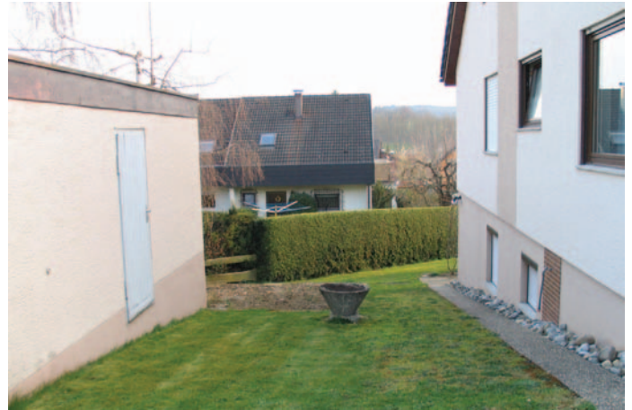
Foto 4: „Und es ward öd und leer“ ... in vielen deutschen Vorgärten.