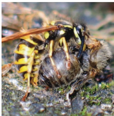
Foto 11a und 11b: An wehrhaften Bienen vergreifen sich Wespen nur nach imkerlichen Fehlern.