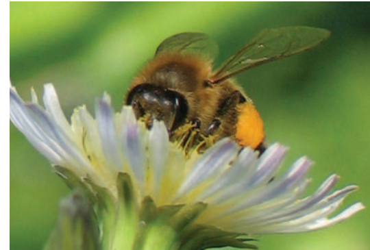
Ein Blick über den Tellerrand ... zu Gunsten von Biene Maja & Co.

Drüsiges Springkraut (Große Balsamine) blüht von Juli bis Oktober, ist hochattraktiv für viele Insekten und