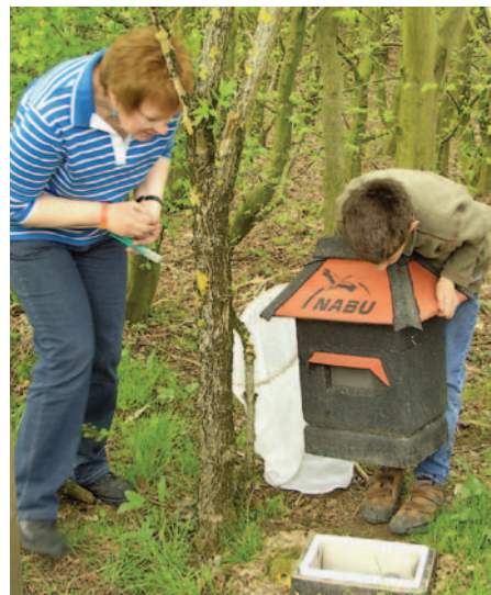
Foto 15: Jemand daheim? Künstliche Nistgelegenheiten erleichtern Hummeln die Wohnungssuche.