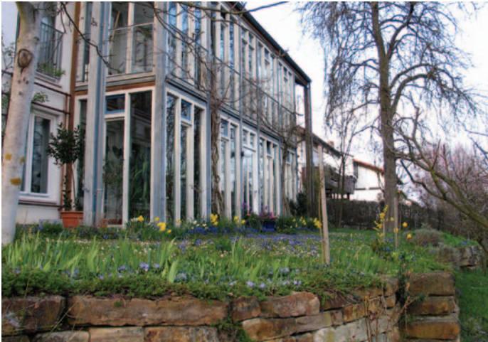
Foto 6: Obstgehölze, Frühjahrsblüher, Trockensteinmauer ... hier herrscht Ordnung und trotzdem ist Platz für Natur.