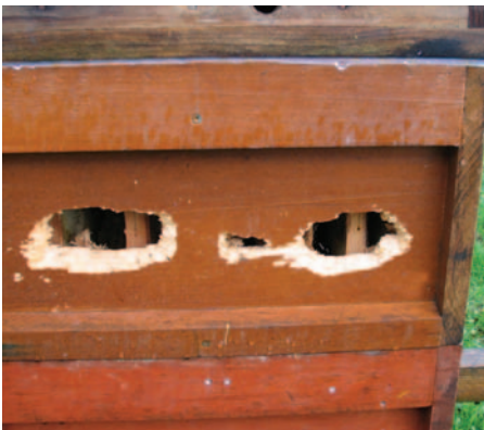
Foto 14: Spechte sind territorial – wer keine Netze zum Schutz seiner Beuten spannen will, verstellt die Bienen einfach um einige hundert Meter.