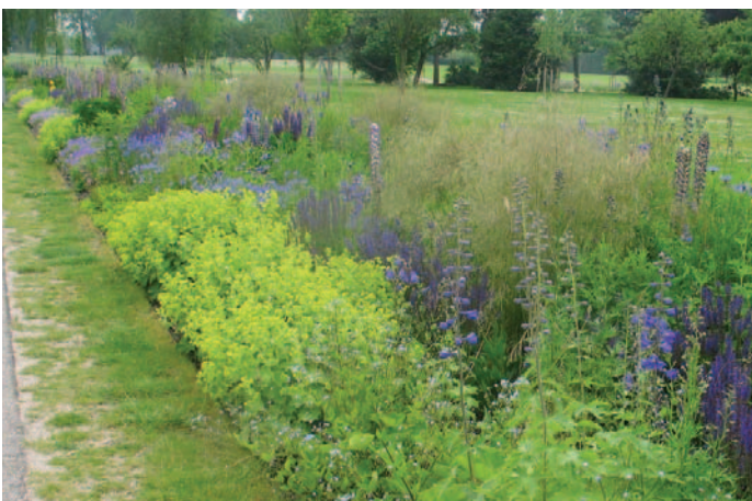
Foto 8: Buffet für Blütenbesucher: optisch ansprechend und doch naturnah.

„Eine Nummer größer“ engagiert sich mancher Imkerverein für eine blütenreiche, dauerhafte Bereicherung der Landschaft durch die Neuanlage von Streuobstwiesen. Einfacher und nahezu kostenlos ist die Anlage einer Benjeshecke („Die Vernetzung von Lebensräumen mit Benjeshecken“, H. Benjes, Natur & Umweltverlag, 1998). Das Prinzip: im Herbst/Winter wird in langen Wällen Strauch- und Laubholz-Baumschnitt an Feldsäumen aufgeschichtet. Davon angelockte Vögel lassen dort frisch verdaute Samen samt Düngerpäckchen fallen, die geschützt vor Wild-