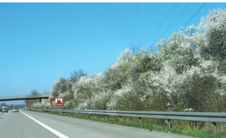
Foto 5: Autobahnrandstreifen, intelligent mit abwechslungsreichen Gehölzen bepflanzt.

„Die Erde aber war wüst und leer ...“ in vielen Gärten (Foto 4). Doch auch Rhododendron, Kirschlorbeer, Serbische Fichte und gefüllte Rosen sind nichts als grüne Wüstenei. So mancher Autobahnrandstreifen beherbergt inzwischen eine höhere Artenvielfalt als der heimatische Golfraus (Foto 5). Die gleichzeitige Klage der Besitzer