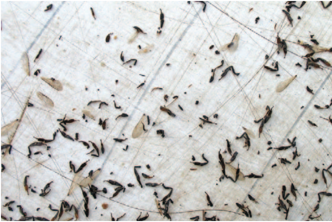
Foto 12: Zahlreiche Bienenbeine in der Windel – hier haben Wespen ein totkrankes Volk entsorgt.