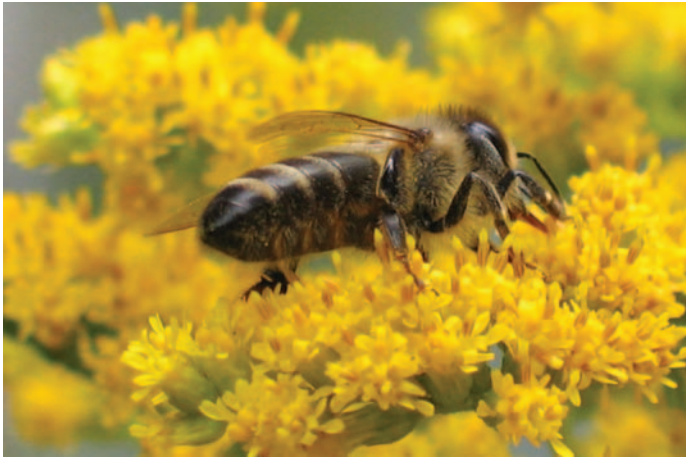
Foto 3: Die kanadische Goldrute, ein weiterer attraktiver Zuwanderer.