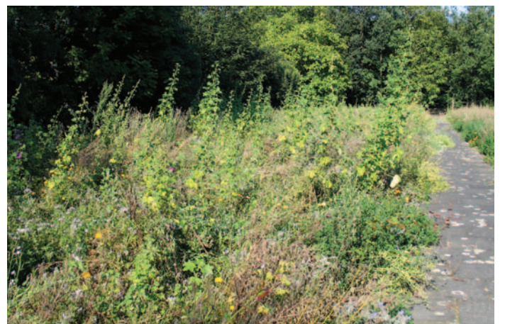
Foto 9: Tübinger Bienenweidemischung – nach dem Abblühen immer noch wertvoll.