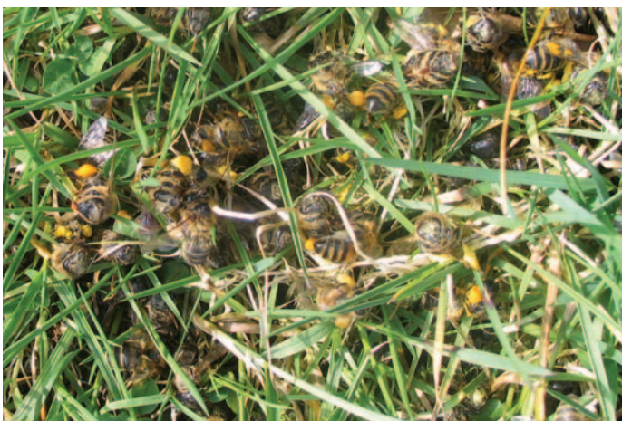
Abb.1: Verendete Pollensammlerinnen bei kühler Witterung im Frühjahr – Gefahr besteht nur für Schwächlinge.

Stabiler beim Abfeigen der Bienen sind zwar gedrahtete Drohnenrahmen, weniger Arbeit machen aber ungedrahtete. Sie können einfach mit dem Stockmeißel ausgeschnitten, Platz sparend in einem dicht schließenden Hobbock gesammelt und später eingeschmolzen werden (vgl. März-Betrachtung). Keine Rähmchen sind zu transportieren oder von Trester zu befreien. Vom Mehrfacheinsatz eines einmal ausgebauten Rahmens halte ich nichts. Es gibt zwar Hinweise auf einen geringfügig höheren Varroabefall dunklerer Waben, diese Differenz lohnt aber bei weitem nicht das Einfrieren, Köpfen und Herausstechen der Drohnen aus den Zellen um