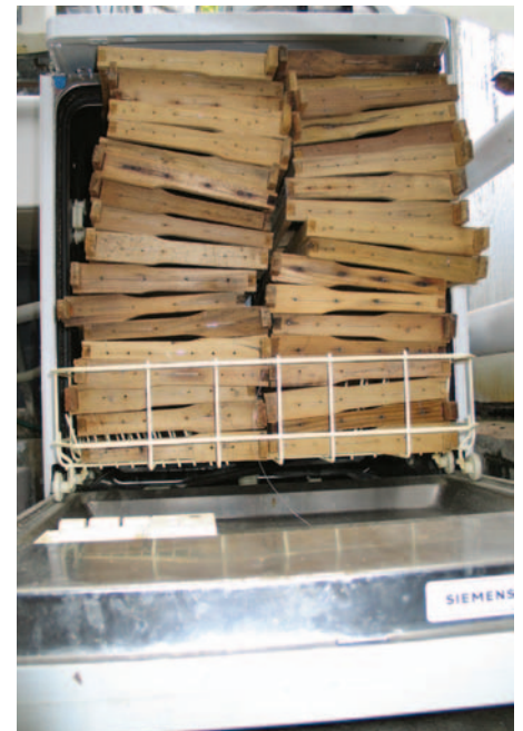
Abb.2 Intelligente Faule überlassen die Reinigungsarbeiten jedoch ihrer alten Geschirrspülmaschine.

Saubere Rähmchen lassen sich viel leichter mit Mittelwänden versehen. Das routinemäßige „Desinfizieren“ unbenutzter Beuten zu Saisonende hingegen ist meist überflüssig. Nur in Fällen von Faulbrutsanierung oder wenn Rückstände fettlöslicher Varroazide entfernt werden sollen, macht das Auskochen oder Auswaschen von Zargen und Böden mit Natronlauge Sinn. Denn gegen Krankheitserreger schützen die Bienen das Beuteninnere ganz eigenständig mit einer „Propolis-Ta-pete“. Wo trotzdem Krankheiten auftreten, sind sie fast immer Folge eines übermäßig hohen Varroabefalls.