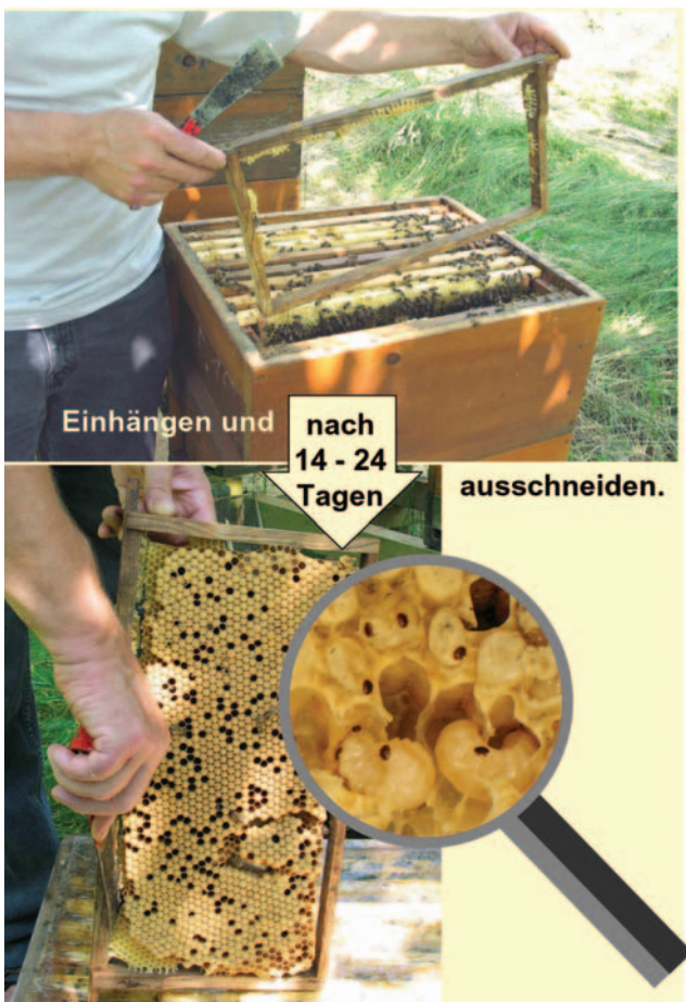
Abb.3 Gelungener Einsatz von Drohnenrahmen sichert reiche „Milbenernte“.

len offenbar dauerhaft darauf herein. Der Wechsel des Baurahmens erfordert keine extra Anfahrt. Er wird mit Erweiterungen und den ab Mitte April allwöchentlich durchzuführenden Schwarmkontrollen kombiniert. Wer hier allerdings schlampft hat mit dem Baurahmen eine Männer- und Milbenfabrik.