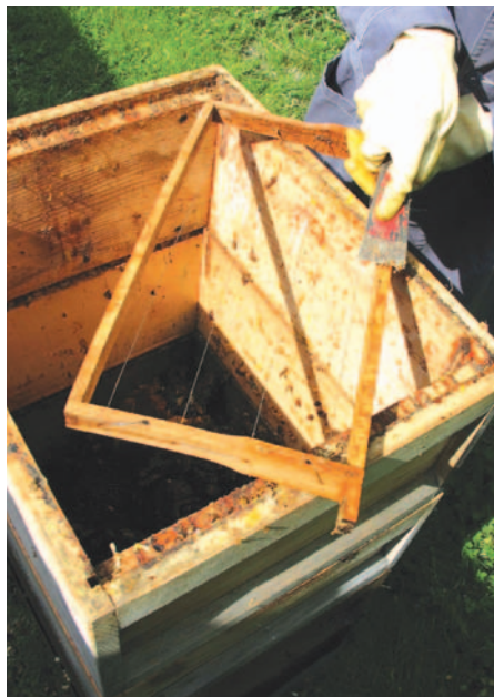
Abb.1 Direkt nach dem Einschmelzen lassen sich die letzten Trester- und Propolisreste leicht abklopfen oder mit dem Stockmeißel abschaben.

zusätzliches Spülmittel, jedoch Spülmaschinensalz. Verseifte Reste im Maschinenboden nach je 3-4 Waschgängen mit einem Spachtel entnehmen, Sieb reinigen. Auch normale Geschirrspülmittel enthalten Natronlauge, die früher oder später die Dichtungen und Schläuche der Waschmaschine angreift. Diese daher vorsichtshalber im Waschkeller aufstellen. Meine alte Maschine hat allerdings bereits etwa 150 Waschgänge à 35 Rähmchen hinter sich und ist noch dicht. Vom „Missbrauch“ der Maschine der Gattin in der Küche rate ich auch aus einem weiteren Grund ab: nach dem Einsatz von Natronlauge bleibt stets ein unangenehmer Geruch in der Maschine zurück.