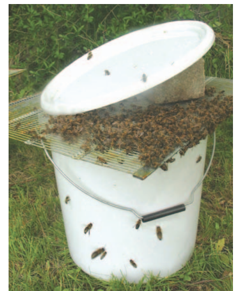
Abb.8 Der Schwarm ist im Eimer! Am Absperrgitter hängt er sich auf. 30 Minuten nach dem Einschlagen kann er direkt am Stand in eine Zarge mit Mittelwänden geschlagen werden. Bei kühlem Wetter etwas zufüttern!