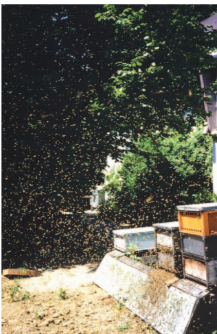
Abb.6 Der Schwarm fällt...und tschüss.

Aber warum einfach, wenn's auch umständlich geht?