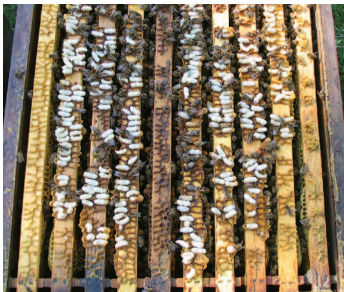
Abb.9 Mit dicken Oberträgern kein Problem mehr: Drohnenzwischenbau.

Regelmäßige Wabenerneuerung ist das A und O jeder guten Imkerei. Direkt nach dem Ausschmelzen alter Waben lässt sich der noch warme Trester leicht z.B. in einen Zargenturm mit aufgespanntem Müllbeutel abklopfen (Abb.1). Sind danach jedoch die Spanndrähte nicht absolut Wachs- und Propolisfrei und damit gut leitend, lassen sich später Mittelwände nur mit Mühe einlöten. Die Rähmchen müssen gereinigt werden. Tagelange Kochorgien mit offener Natronlauge in einem großen offenen Zuber, gefolgt von zeitraubendem Abbürsten der letzten Wachsreste und Spülen mit dem Dampfstrahler sind dazu jedoch nicht nötig.