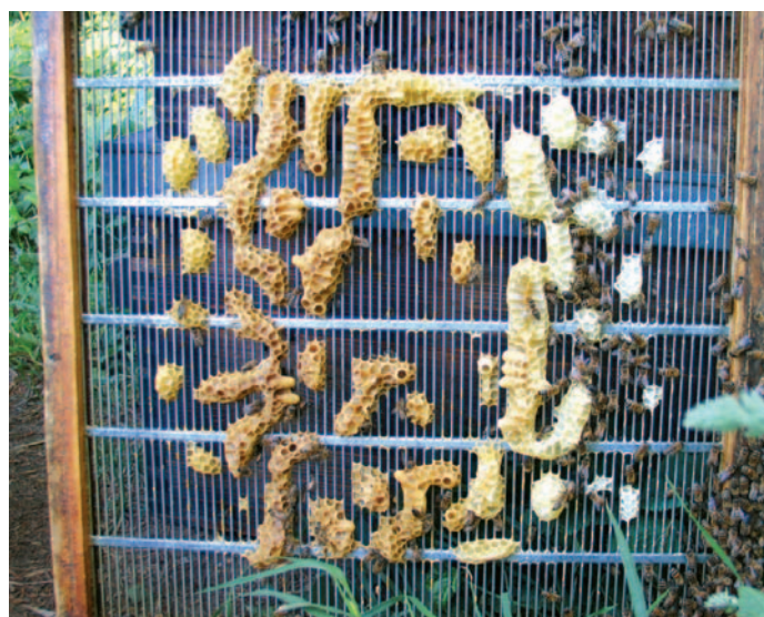
Abb.10 Absperrgitter ohne Rahmen erleichtern das imkerliche Tun: nie wieder solcher Verbau oder versteckte Schwarmzellen.